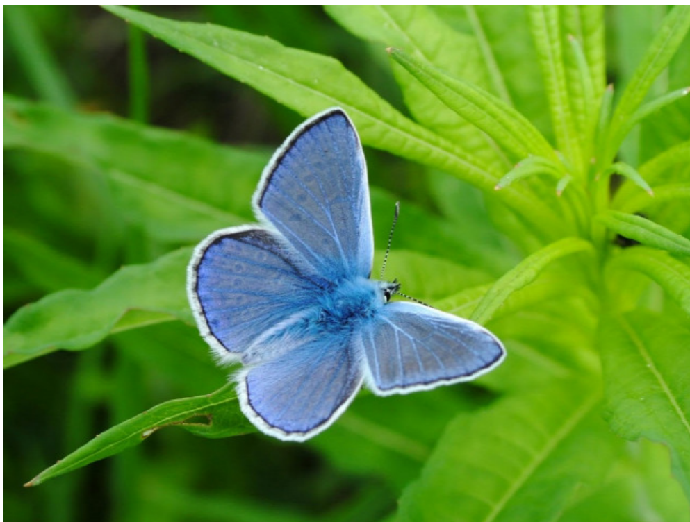
Ikarusz boglárka

Ez egy, még nem teljesen feltárt, úgynevezett önszerveződési folyamat során történik a hernyó bábállapotában, amikor a pikkelysejt által előállított fehérjék „maguktól” felépítik ezt a nanocsipkét. Mégis, az egyes pikkelyek színe gyakorlatilag megegyezik! Sőt, nemcsak egy adott lepkeegyed pikkelyeinek színe egyezik meg, hanem az egyes populációkban előforduló színek is nagyon szűk tartományba esnek, a változás alig \pm 5\% az egyes példányok között.